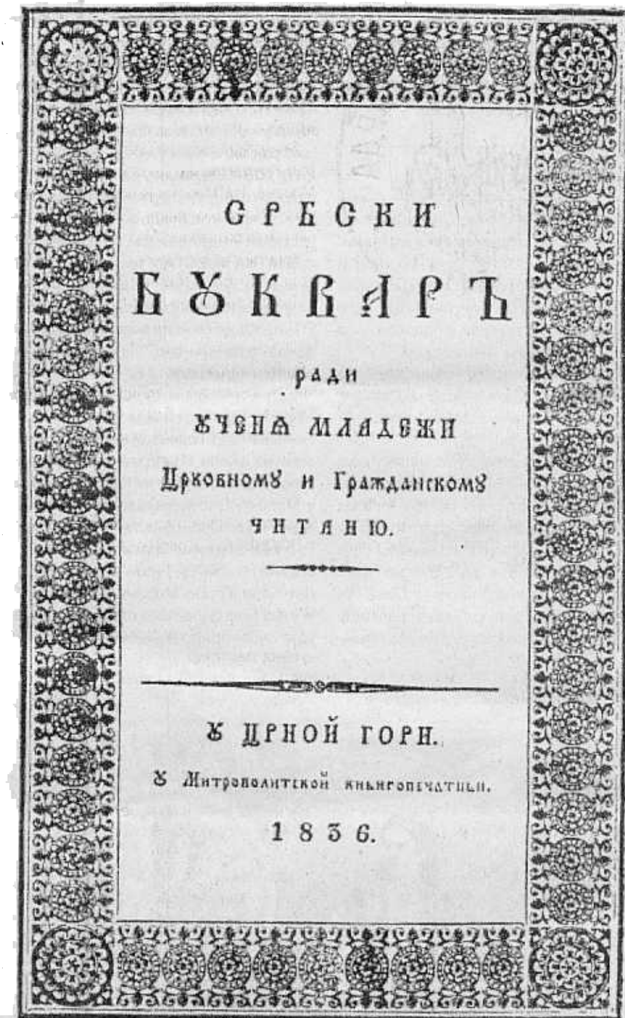
Насловна страна Буквара из 1836. године

коњанички пут, којим се иде од Полимља преко Андријевице уз ријеку Тару, па преко Вјетерника.